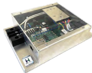
蛍光灯調光装置 特許第 3634982 号 特許第 3735673 号 他